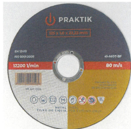
Ściernica płaska do przecinania typ 41 / Flat cutting-off wheel 41 type 125×1,0×22,23

Załącznik stanowi integralną część Certyfikatu Nr B-081/22. This Attachment forms an integral part of the Certificate No. B-081/22.